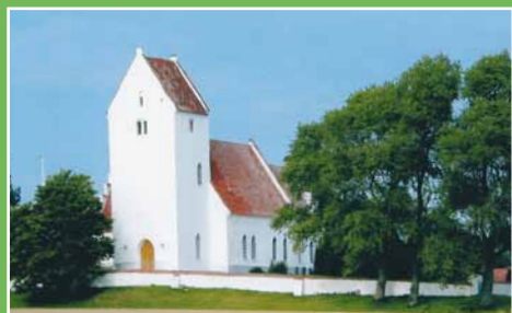
For Kalvehave og Stensby sogne