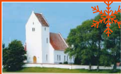
For Kalvehave og Stensby sogne