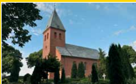
Nr. 2 • Juni-August 2013