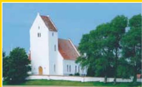
For Kalvehave og Stensby sogne